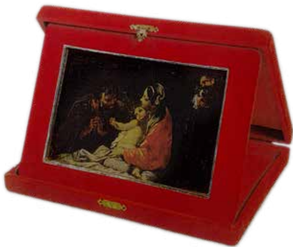
La piccola Sacra Famiglia di Cignaroli, talismano di Maria Callas

In una scena notturna si delinea uno spazio chiuso sul fondo da un drappo con le figure di Maria col Bambino e San Giuseppe in primo piano, accompagnate da due luminosi cherubini. L'iconografia è dunque quella di una Sacra Famiglia , soggetto assai diffuso anche grazie a piccole immagini per la devozione privata come questa tavola di Cignaroli che replica in miniatura il soggetto di un'altra tela attribuita al suo maestro Antonio Balestra (olio su tela, 76 x 114 cm), oggi conservata all'Eli & Edythe Broad Art Museum (Michigan State University, East Lansing) e di altri esemplari, sempre attribuiti a Balestra, a Fabrizio Cartolari o allo stesso Cignaroli, tra i quali quello al Museo de Montserrat (olio su tela, 80 x 111 cm) e l'esemplare in collezione privata a Venezia inserito in una raffinata cornice con cimasa (olio su tela, 76 x 113 cm). La storia del piccolo dipinto che appartenne a Maria Callas