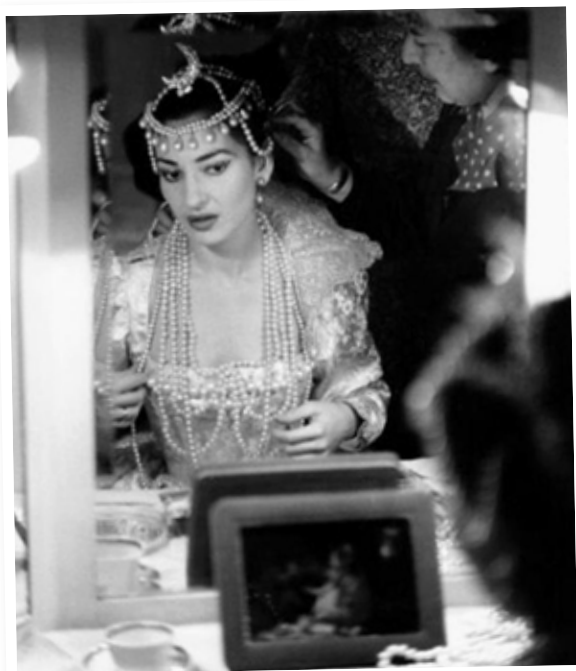
Maria Callas in camerino mentre si prepara ad interpretare Ifigenia di Gluck, Milano 1957.

Per la donna che ha incarnato più di tutte il ruolo della primadonna il ritorno al teatro è dunque l'unica ragione di sopravvivenza. Così, tra il 1971 e il 1973, tiene una Masterclass alla Juilliard School di New York e si cimenta, insieme a Giuseppe Di Stefano, nella regia dell'opera I Vespri Siciliani di Giuseppe Verdi, l'opera che inaugura il nuovo Teatro Regio di Torino (10 aprile 1973).