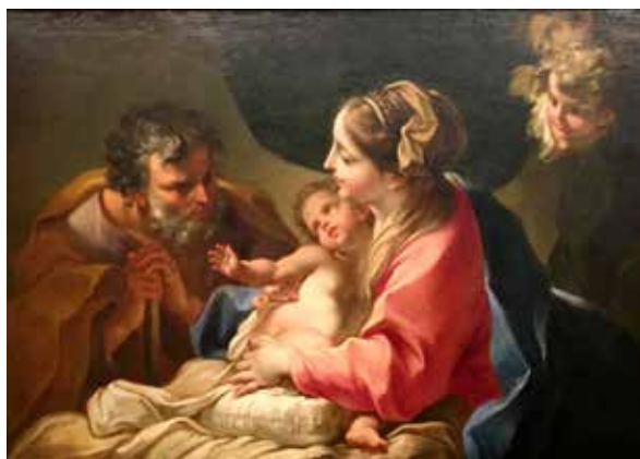
Sacra Famiglia , MSU Broad Art Museum - Michigan State University

La stessa teletta già di Maria Callas dalle misure quanto mai ridotte, quasi miniaturistiche, cm 13x19, pare essere una riproduzione del fortunato prototipo eseguita probabilmente nella bottega di Balestra, nella quale Cignaroli peraltro si formò, per qualche committente desideroso di veder replicato in dimensioni "portatili" una composizione così accattivante in cui la tenerezza un po' ammiccante dei tre protagonisti è accentuata da un sapiente gioco di sguardi e di gestualità.