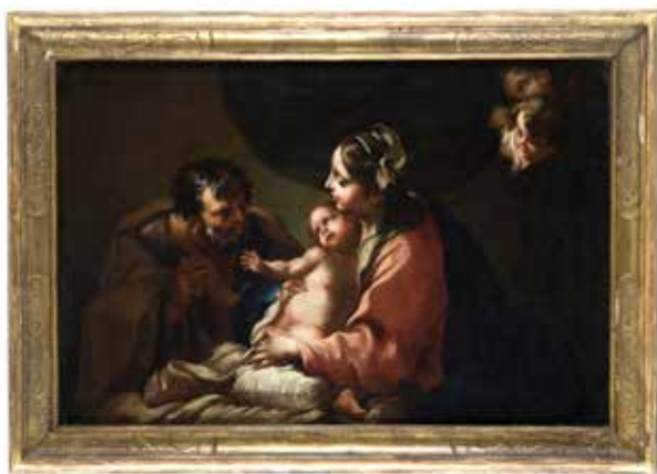
Sacra Famiglia , già Roma Bolli & Romiti