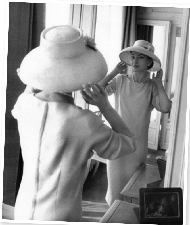
Maria Callas al Claridge's Hotel di Londra, giugno 1958, Ph Zoe Dominic. Sul comodino in basso a destra il suo talismano.

stagione operistica all'Arena di Verona, che la scrittura immediatamente come protagonista dell'opera La Gioconda di Amilcare Ponchielli, il cui allestimento è previsto nella città scaligera per l'estate del 1947.