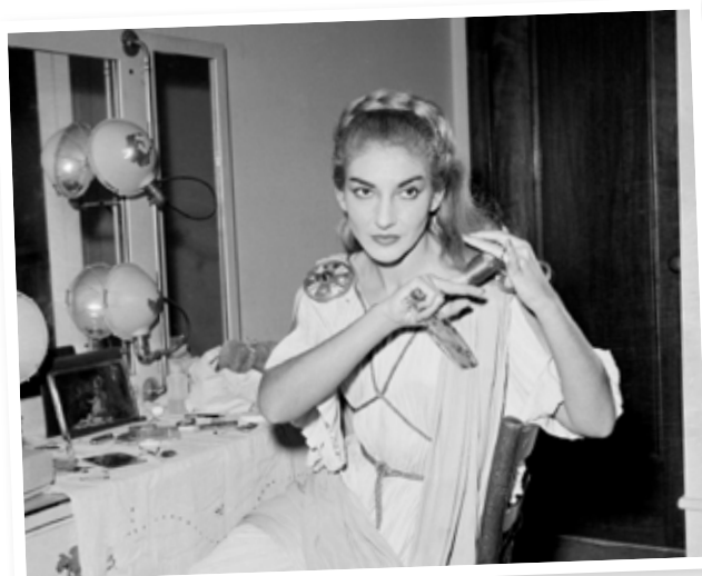
Maria Callas in camerino per Norma a Chicago nel novembre 1954. Appoggiato allo specchio il piccolo dipinto di Cignaroli.