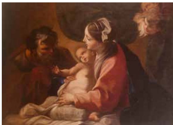
Sacra Famiglia , Montserrat, Museu de Montserrat