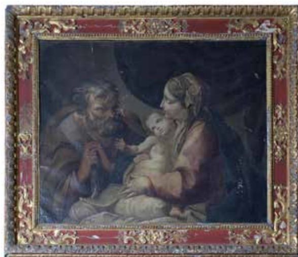
Sacra Famiglia , Villanova Maiardina (MN), chiesa parrocchiale