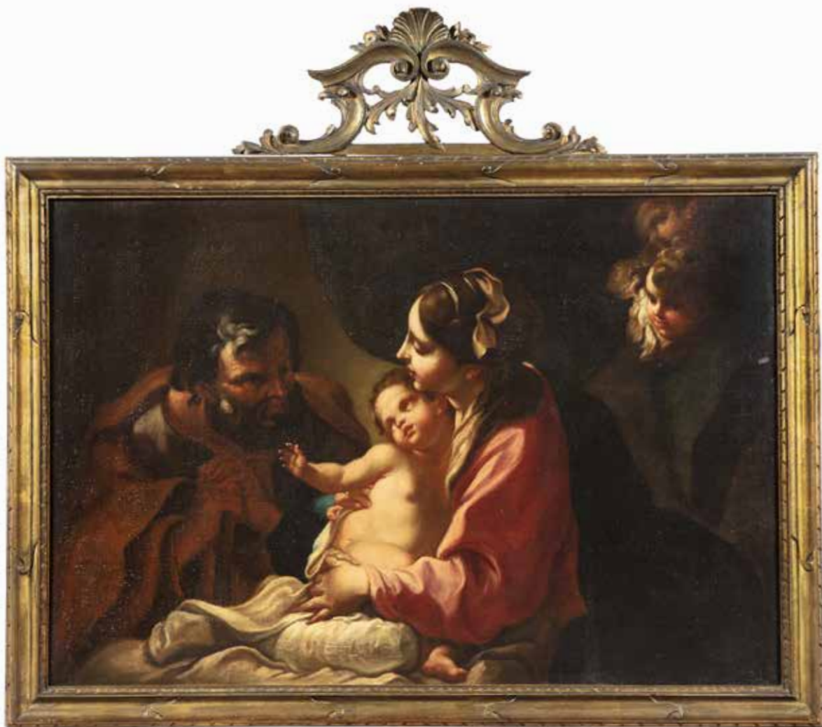
Sacra Famiglia , Venezia, collezione privata