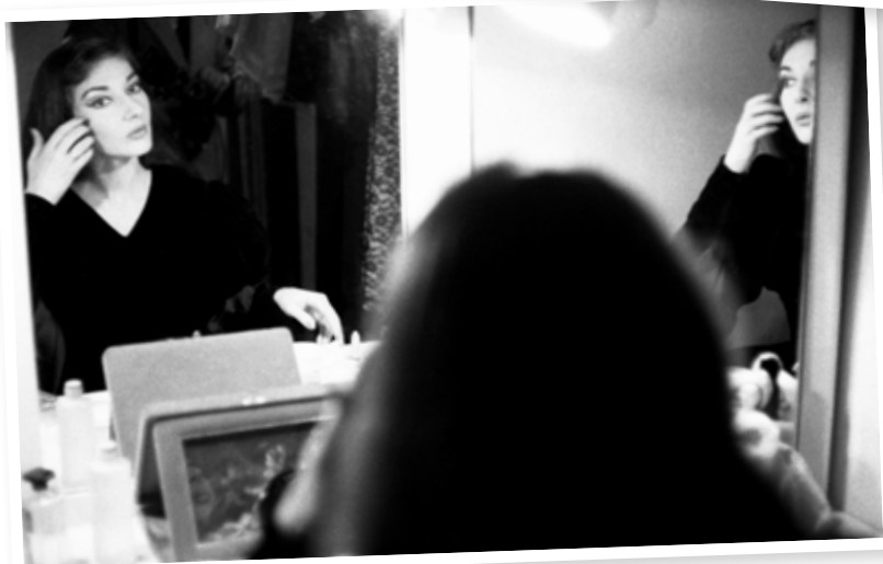
1950-1958. Maria Callas con l'inseparabile Sacra Famiglia di Cignaroli in alcuni scatti in camerino, in televisione e nelle sue case di Verona e Milano.